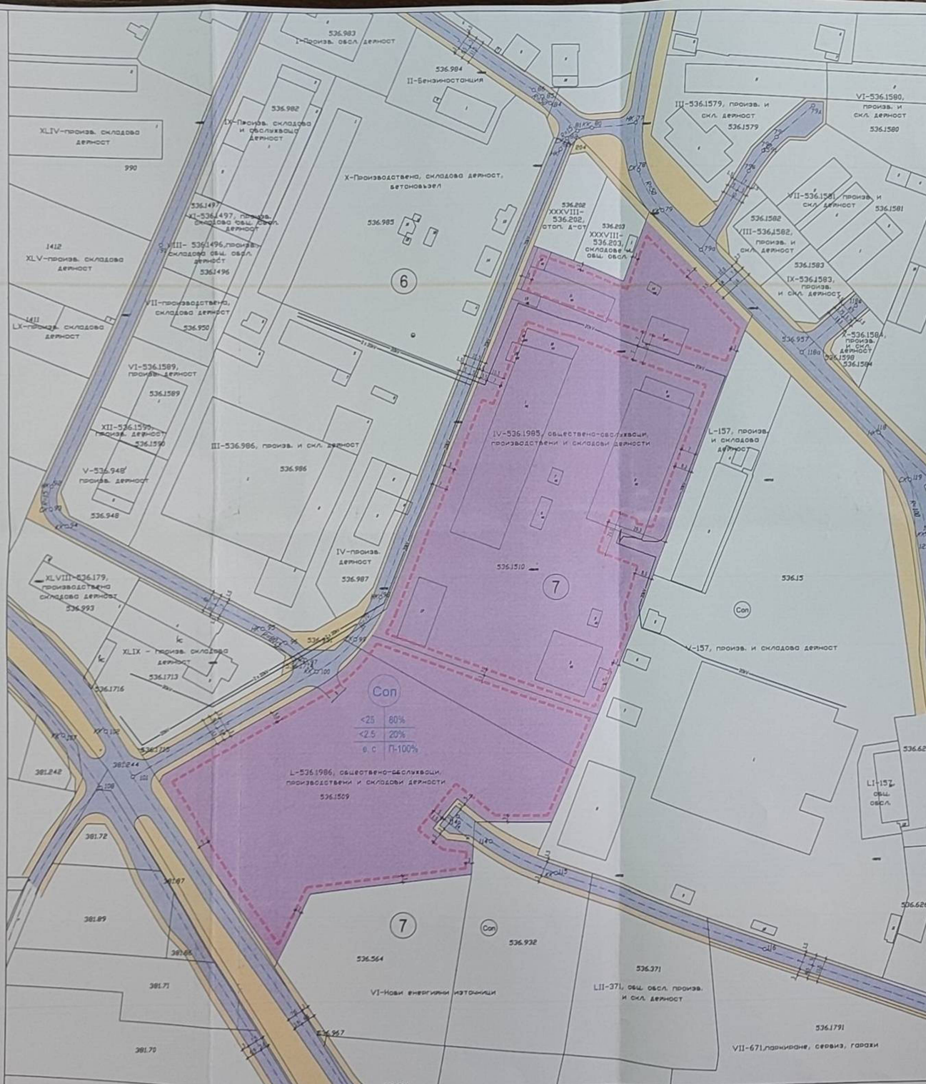
ПЛАН ЗА ЗАСТРОЯВАНЕ