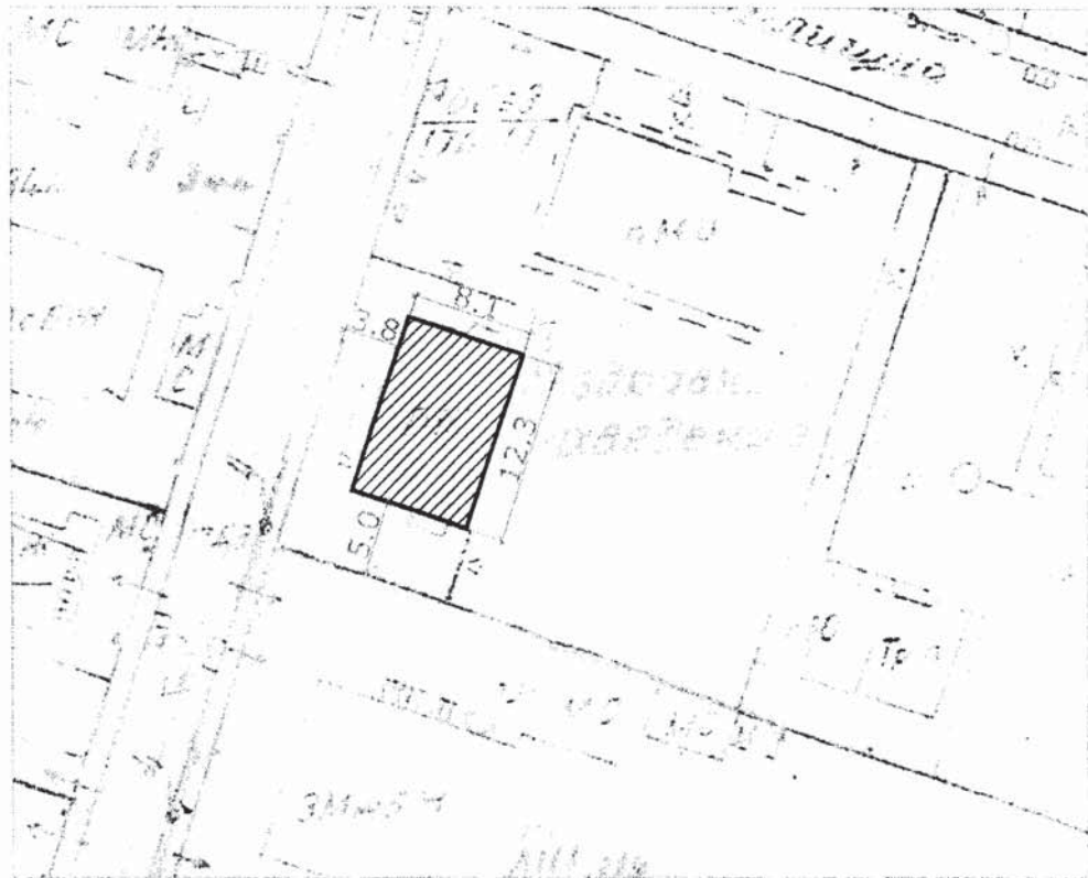
Схема на съществуващия обект